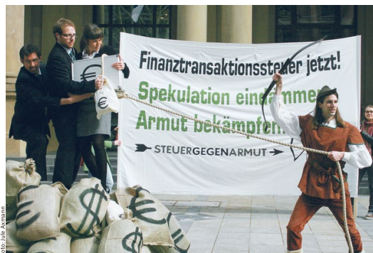
Der Mann aus Sherwood Forest in der Neuzeit: Von den Zockern nehmen, den Armen geben.

Alternativvorschläge zum Kaputtsparen gibt es also reichlich. Es fragt sich nur, warum sich die Bundesregierung so heftig dagegen sträubt, sie zur Kenntnis zu nehmen. Vielleicht sollte sie bedenken, dass internationale Umfragen immer wieder die Finnen als die glücklichsten Menschen der Welt identifizieren – und das, obwohl in kaum einem Land so hohe Steuern – besonders für Spitzenverdiener – zu zahlen sind.